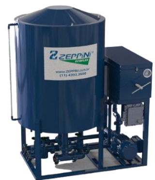
Filtro Prensa para Óleo Diesel - Super