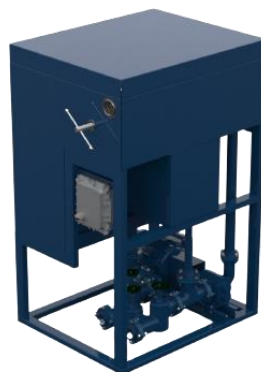
Filtro Prensa para Óleo Diesel - Pro