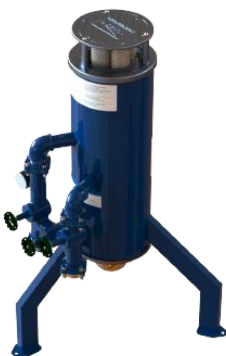
Filtro de Linha para Óleo Diesel - Rocket

Os Filtros para Óleo Diesel da Zeppini Ecoflex estão disponíveis em três modelos: