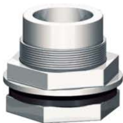
Bucha de Vedação para Caixa de Passagem

A Bucha de Vedação da Zeppini Ecoflex está disponível em um modelo: